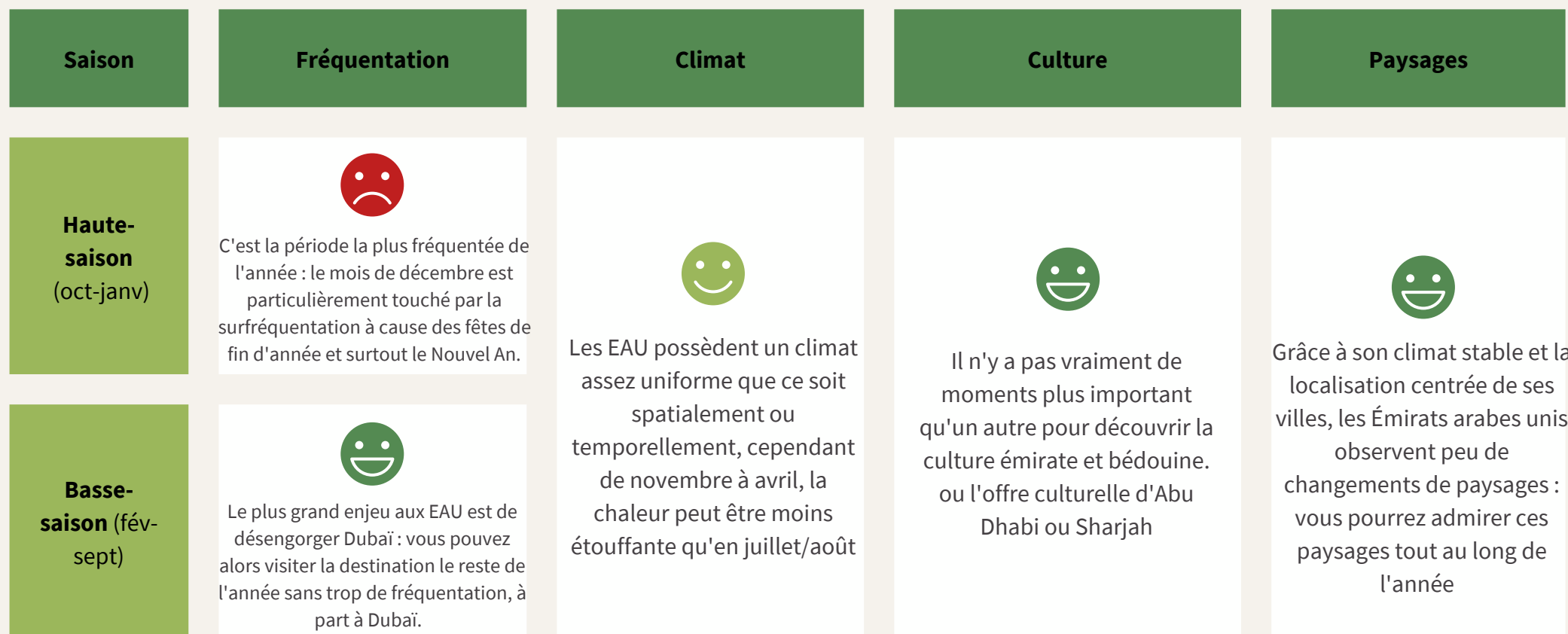
Tableau de saisonnalité : quand partir aux Emirats Arabes Unis ?

Suivre et signer la charte éthique du voyageur disponible sur le site d'ATR.